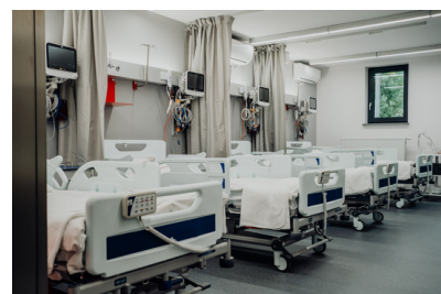
Centrum Wsparcia Badań Klinicznych