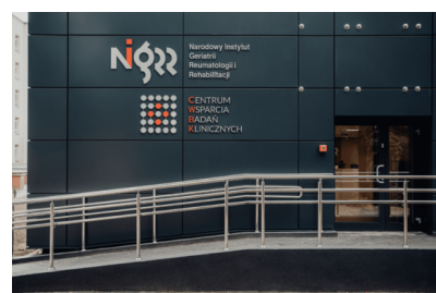
Centrum Wsparcia Badań Klinicznych