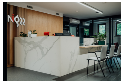
Centrum Wsparcia Badań Klinicznych

W ośrodku łączone są wysiłki klinicystów, farmaceutów i specjalistów z dziedziny biologii molekularnej a pacjenci biorący udział w badaniu klinicznym są otoczeni specjalistyczną opieką i otrzymują wsparcie również po jego zakończeniu. Celem CWBK jest stanie się oczywistym wyborem dla dzisiejszych badaczy – zarówno lekarzy z bogatym doświadczeniem badawczym, jak i młodych lekarzy chcących pozyskać wiedzę i doświadczenie w prowadzeniu badań klinicznych. Dodatkowo, dzięki współpracy z innymi ośrodkami zdrowia, Centrum promuje innowacyjne terapie