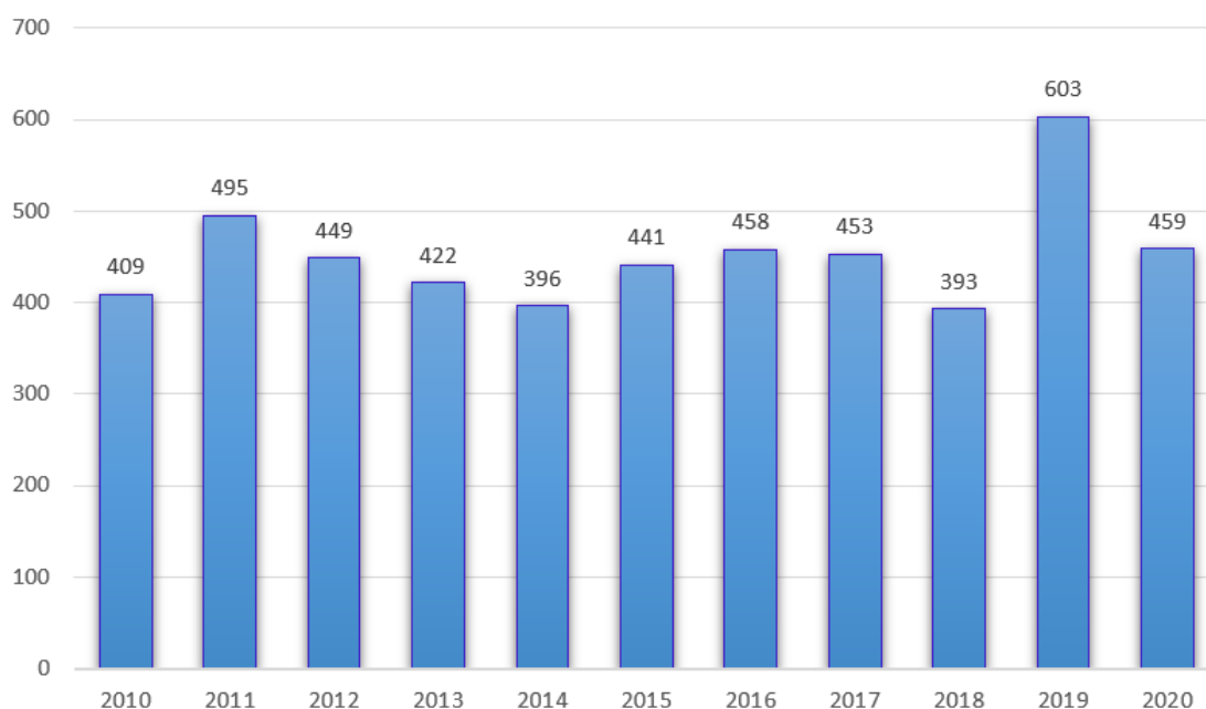
Liczba badań klinicznych zarejestrowanych w Polsce w latach 2010-2020

Liczba badań klinicznych zarejestrowanych w Polsce lata 2010-2020 (źródło: URPL)